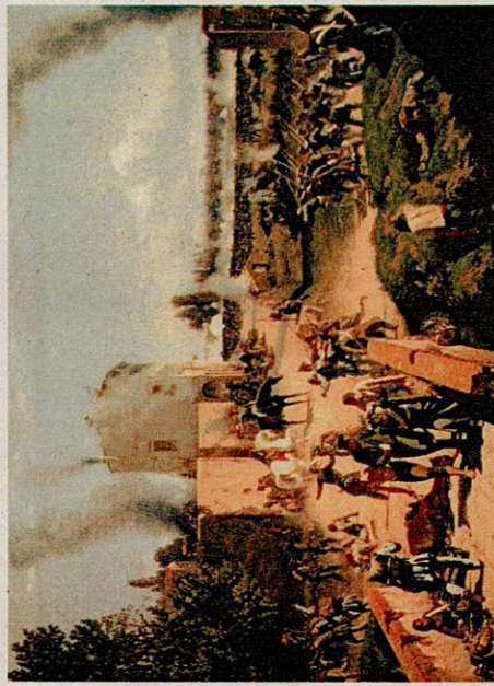
Pietro Senno, I Toscani a Curtatone, Campagna del 1848. Veduta presa sul Ponte dell'Osona, Collezione Ente Cassa di Risparmio di Firenze

170° Anniversario della Battaglia di Curtatone e Montanara del 29 maggio 1848