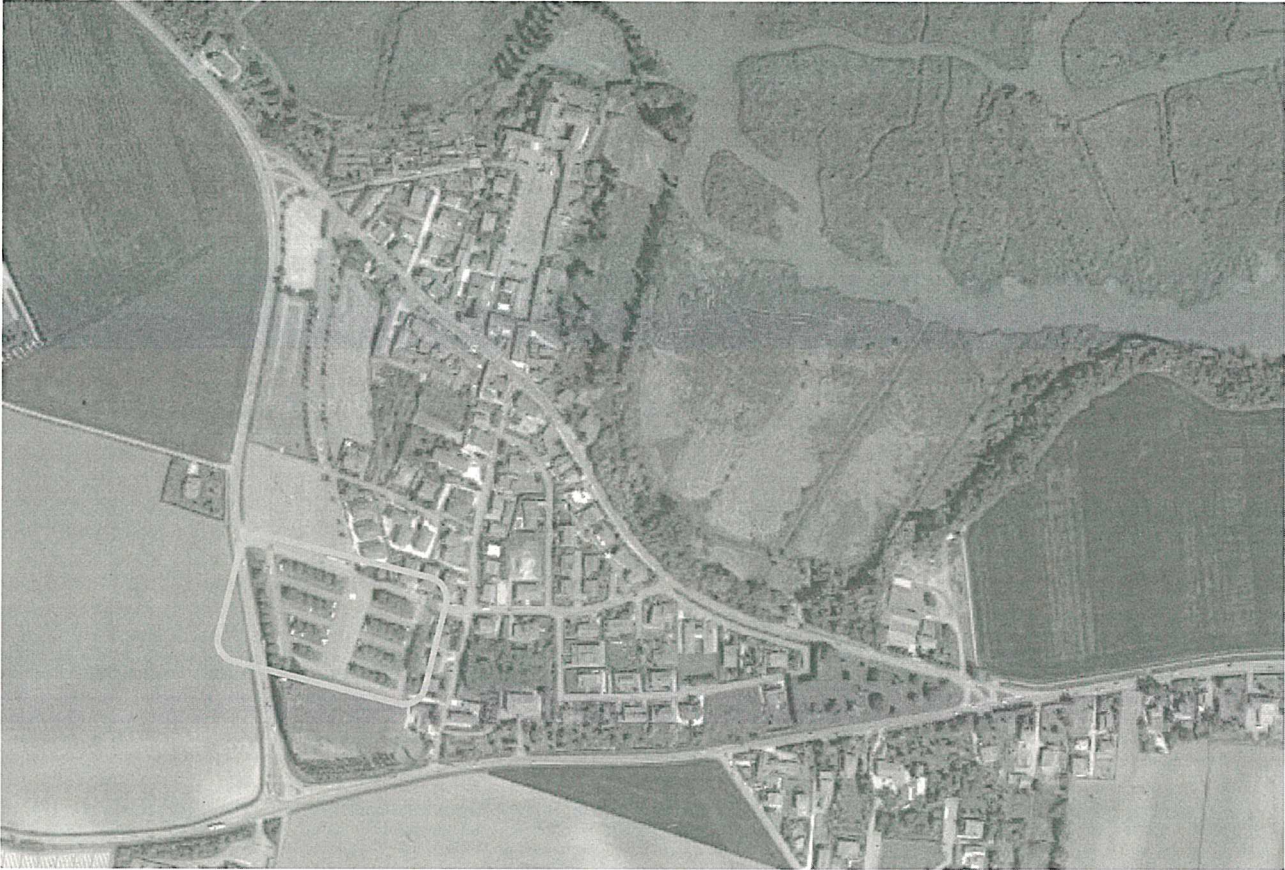
Sopra_ vista aerea della frazione Grazie con individuazione dell'area camper

L'area oggetto di intervento si trova nel Parco "Paganini" in Via della Fiera n. 1 al confine sud-ovest dell'abitato della frazione di Grazie di Curtatone e confina a sud con il campo sportivo comunale, a nord con un'ampia zona parcheggio libero, ad est con la zona residenziale e ad ovest con la SP 1 che ne garantisce un facile accesso per i camper che non devono attraversare zone residenziali per accedere all'area. Gli accessi all'area carrabile e pedonale avvengono entrambi da Via della Fiera, l'accesso carrabile è a doppia corsia di marcia.