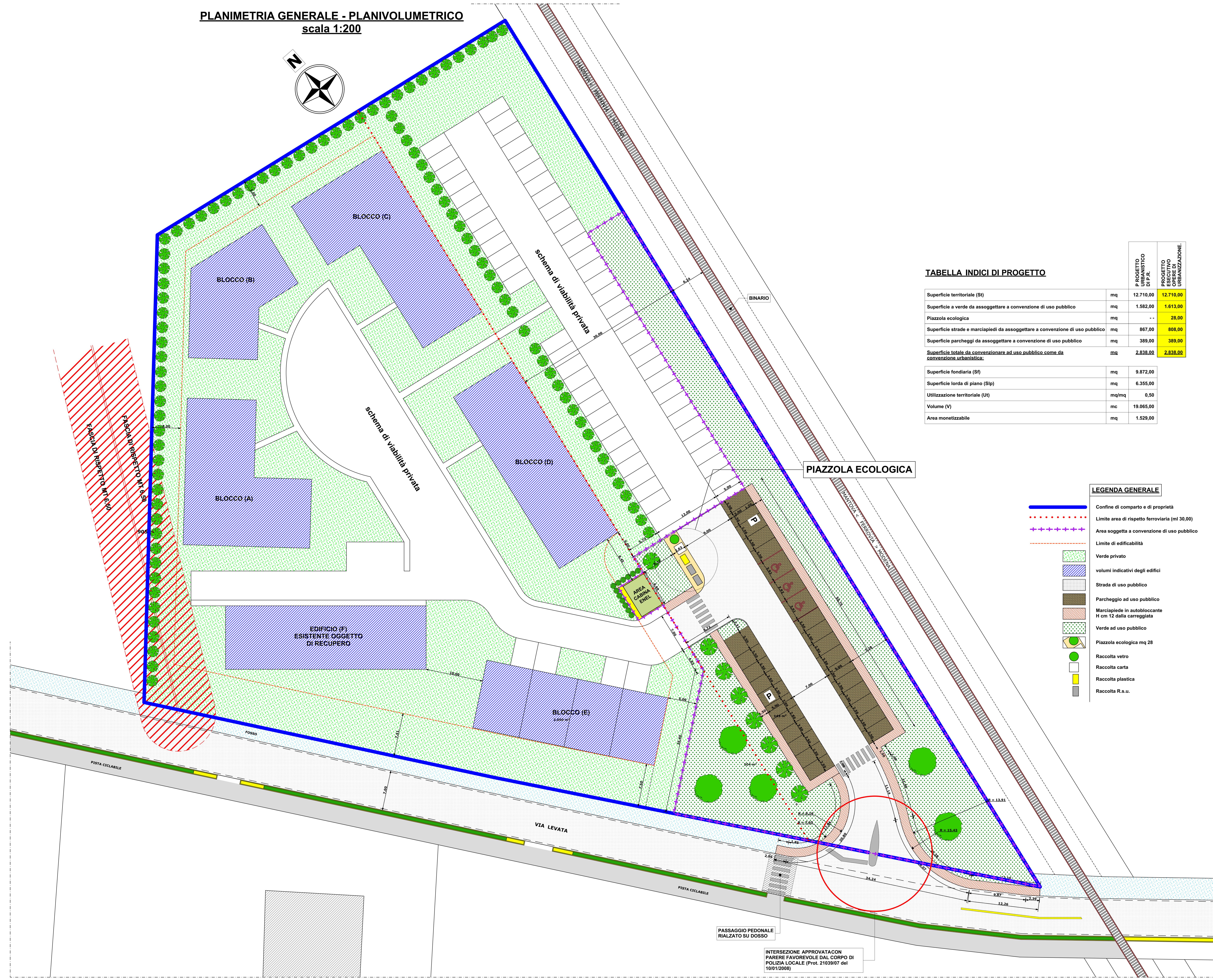
TABELLA INDICI DI PROGETTO