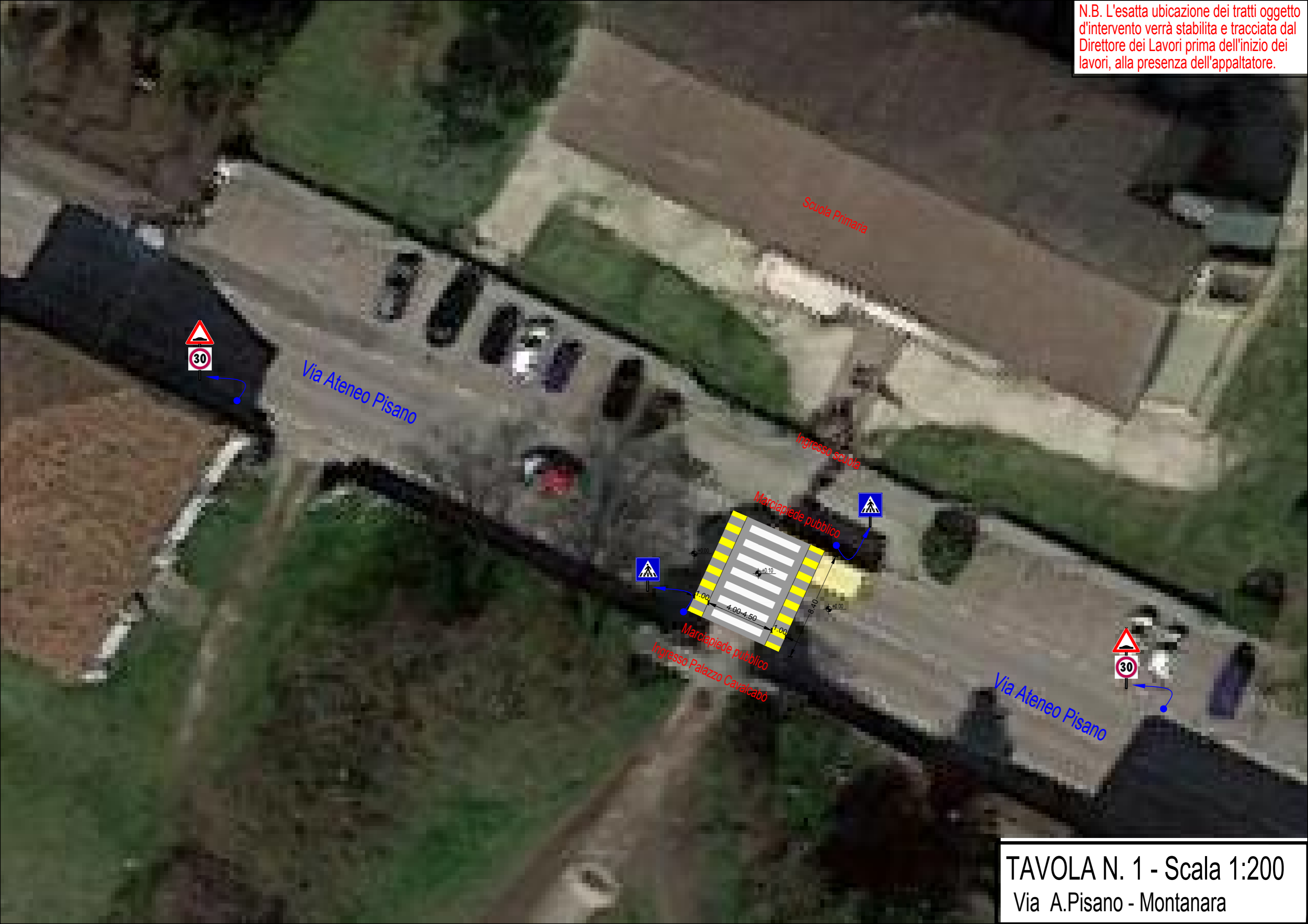
TAVOLA N. 1 - Scala 1:200 Via A.Pisano - Montanara

N.B. L'esatta ubicazione dei tratti oggetto d'intervento verrà stabilita e tracciata dal Direttore dei Lavori prima dell'inizio dei lavori, alla presenza dell'appaltatore.