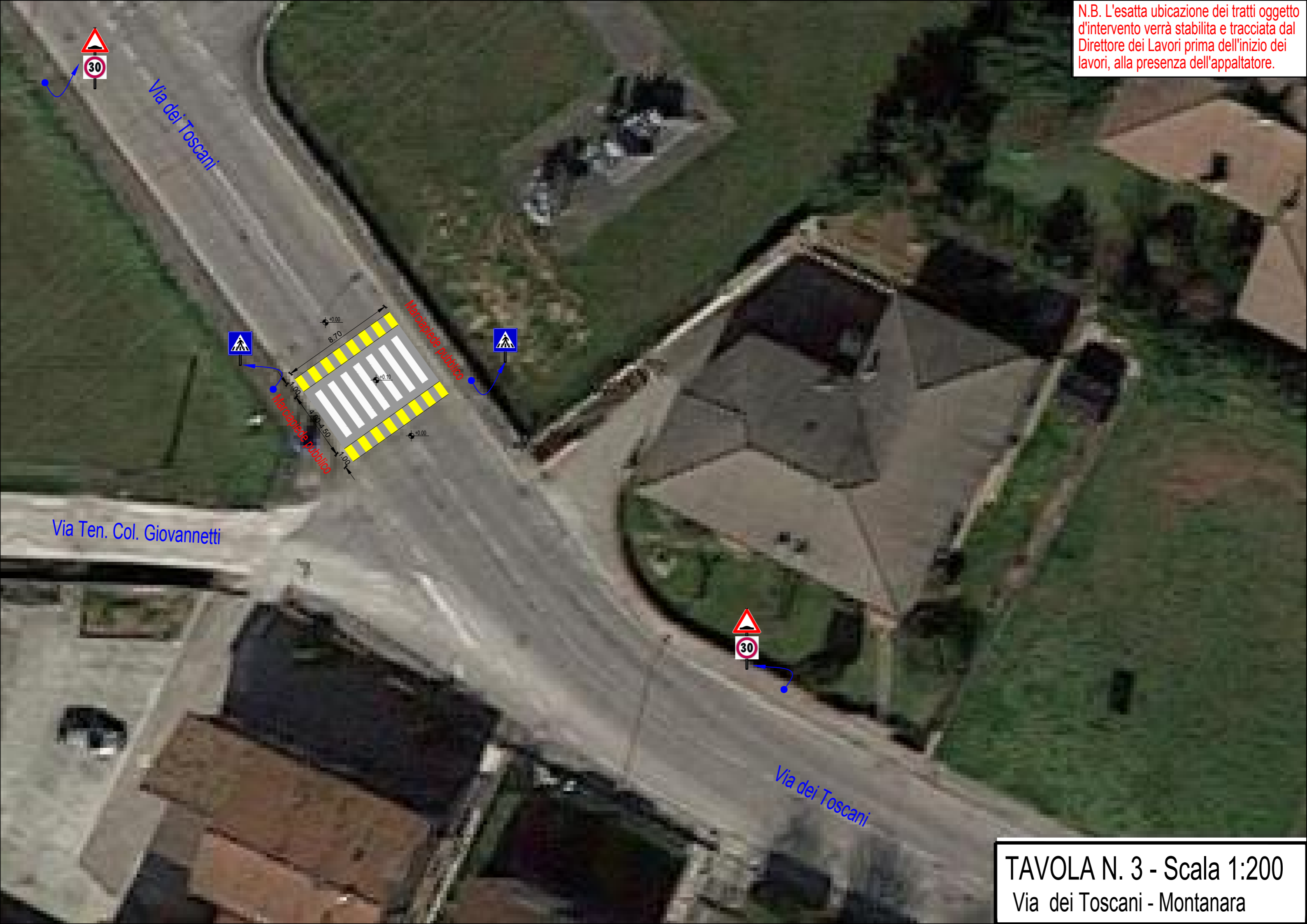
TAVOLA N. 3 - Scala 1:200 Via dei Toscani - Montanara

N.B. L'esatta ubicazione dei tratti oggetto d'intervento verrà stabilita e tracciata dal Direttore dei Lavori prima dell'inizio dei lavori, alla presenza dell'appaltatore.