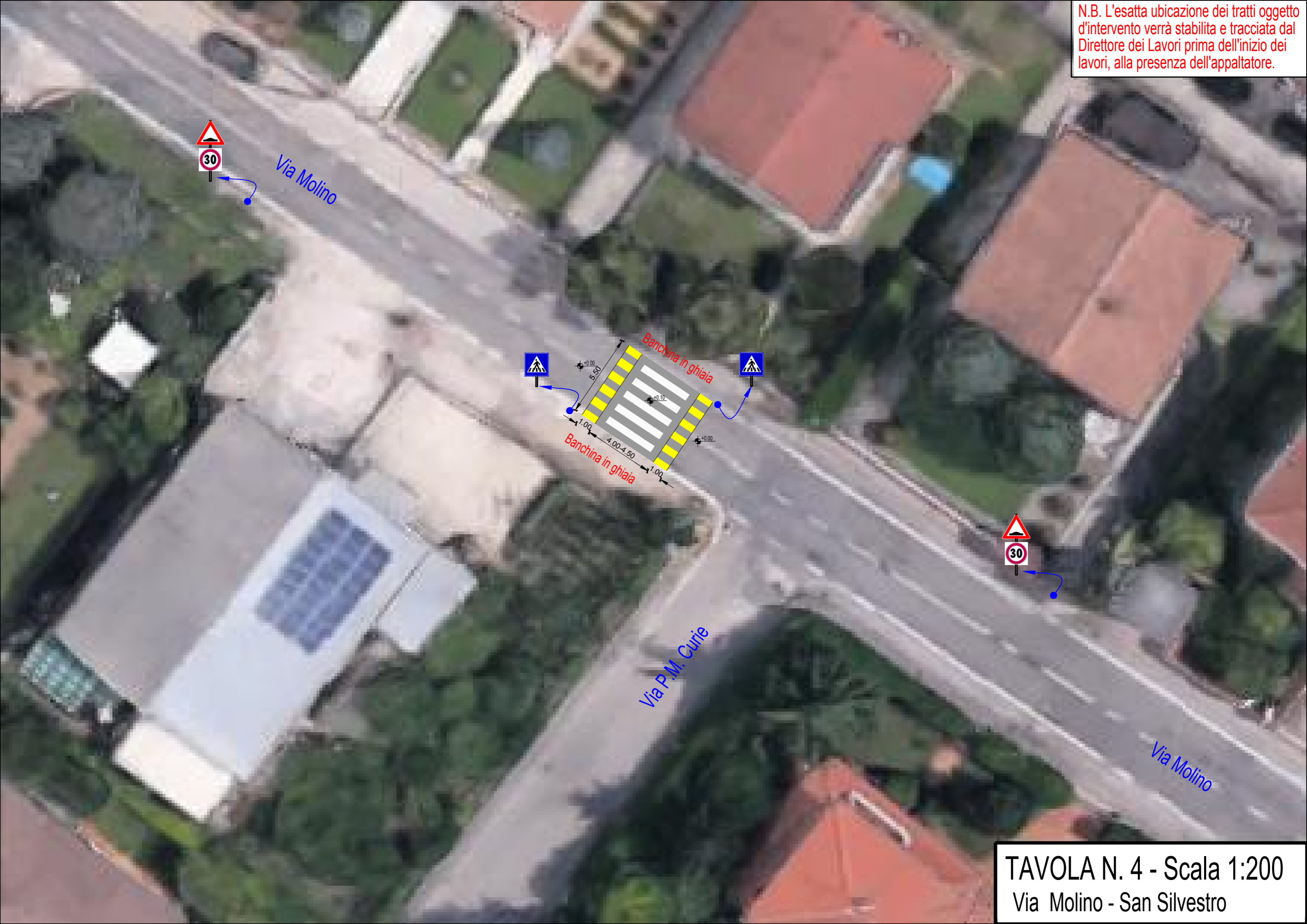
TAVOLA N. 4 - Scala 1:200 Via Molino - San Silvestro

N.B. L'esatta ubicazione dei tratti oggetto d'intervento verrà stabilita e tracciata dal Direttore dei Lavori prima dell'inizio dei lavori, alla presenza dell'appaltatore.