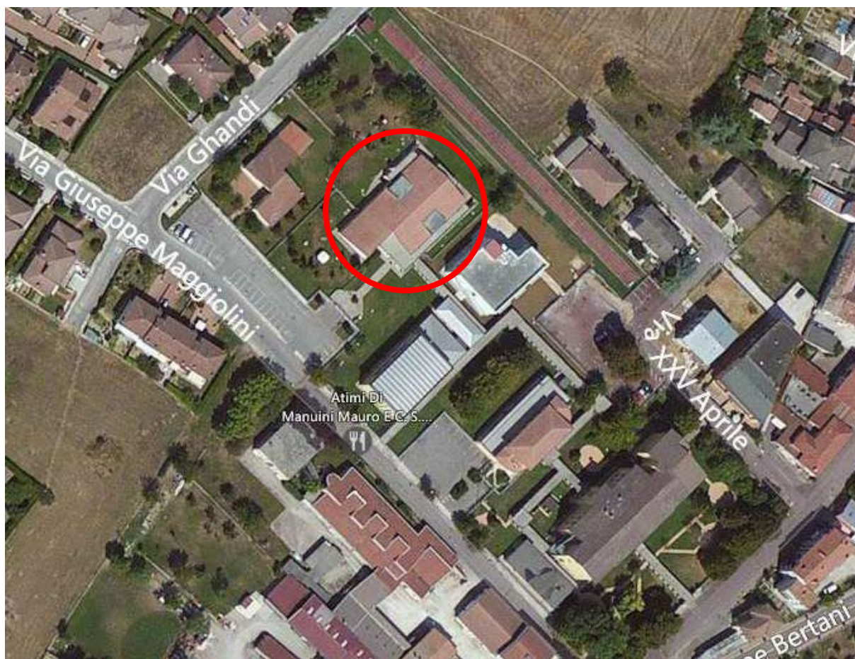
Figura 1: localizzazione edificio

In data 09 luglio 2020, con contratto n.ro 8815 di Rep., sono stati affidati, al Consorzio Stabile Ventimaggio Società Consortile a r.l. con sede in via Canapè, s.n.c., a Patti (ME), le opere relative al progetto di miglioramento della prestazione strutturale da eseguirsi sulla scuola dell'infanzia sita nella frazione di Buscoldo, del Comune di Curtatone, in via Maggiolini, n.ro 10.